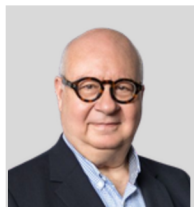
Jean-Philippe Bernard Gouvernance pour administrateurs