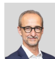
Jérôme Piguet Crédits